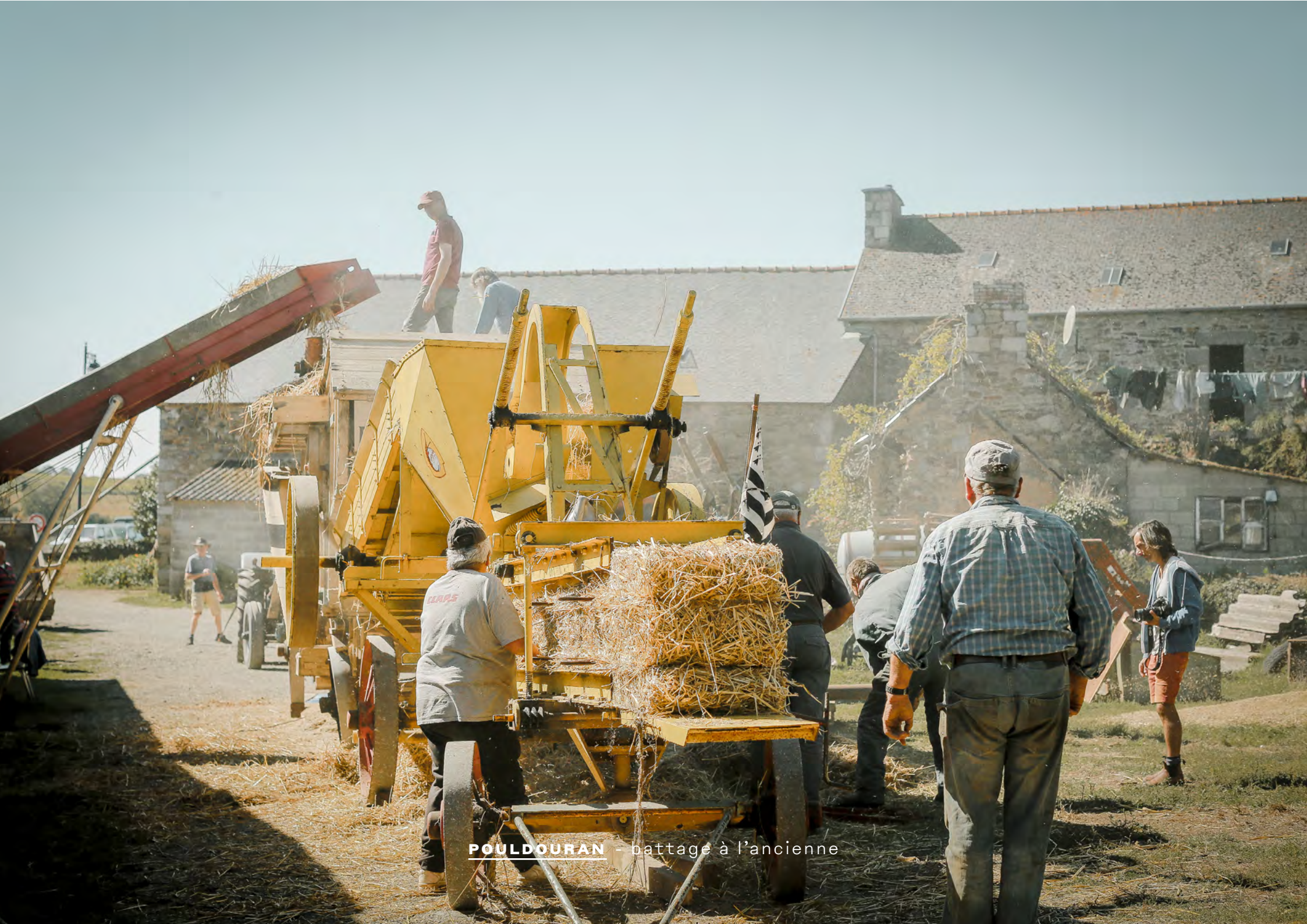
POULDOURAN - battage à l'ancienne