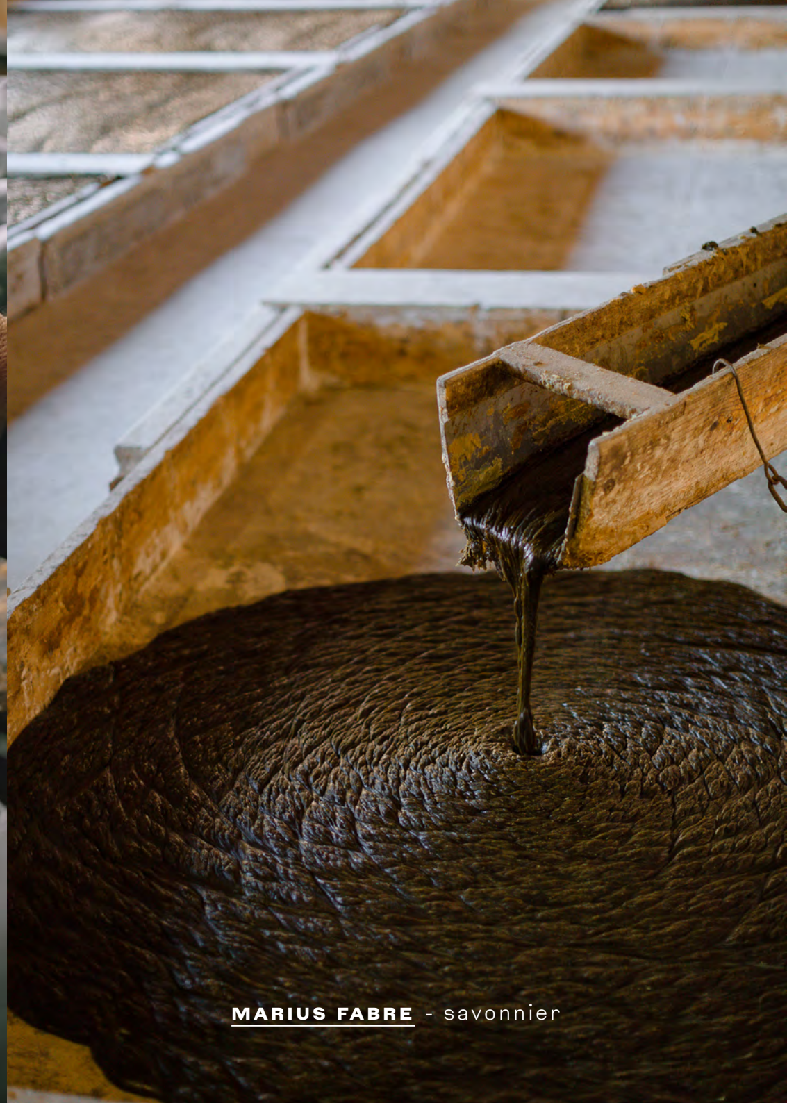
MARIUS FABRE - savonnier