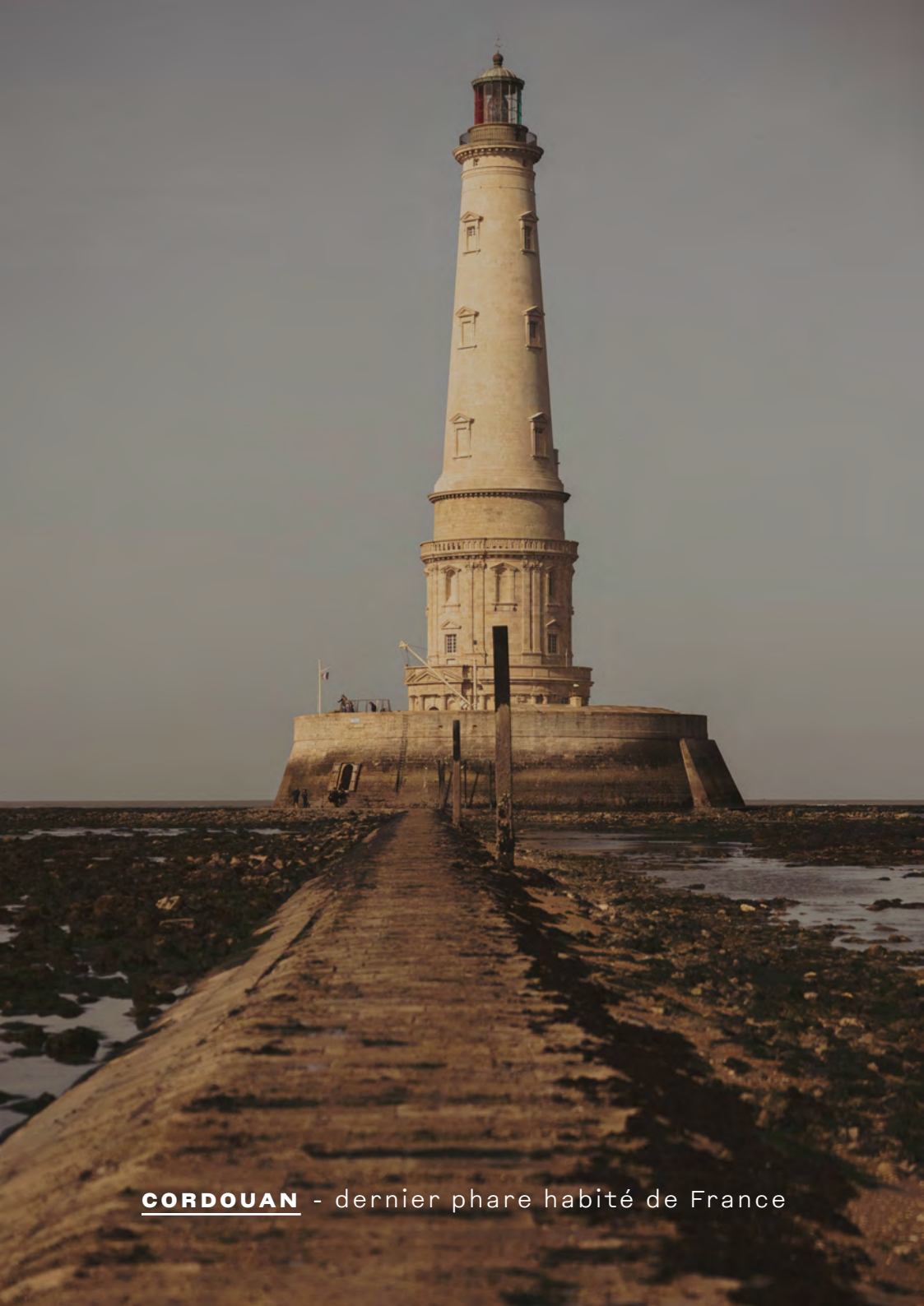
CORDOUAN - dernier phare habité de France