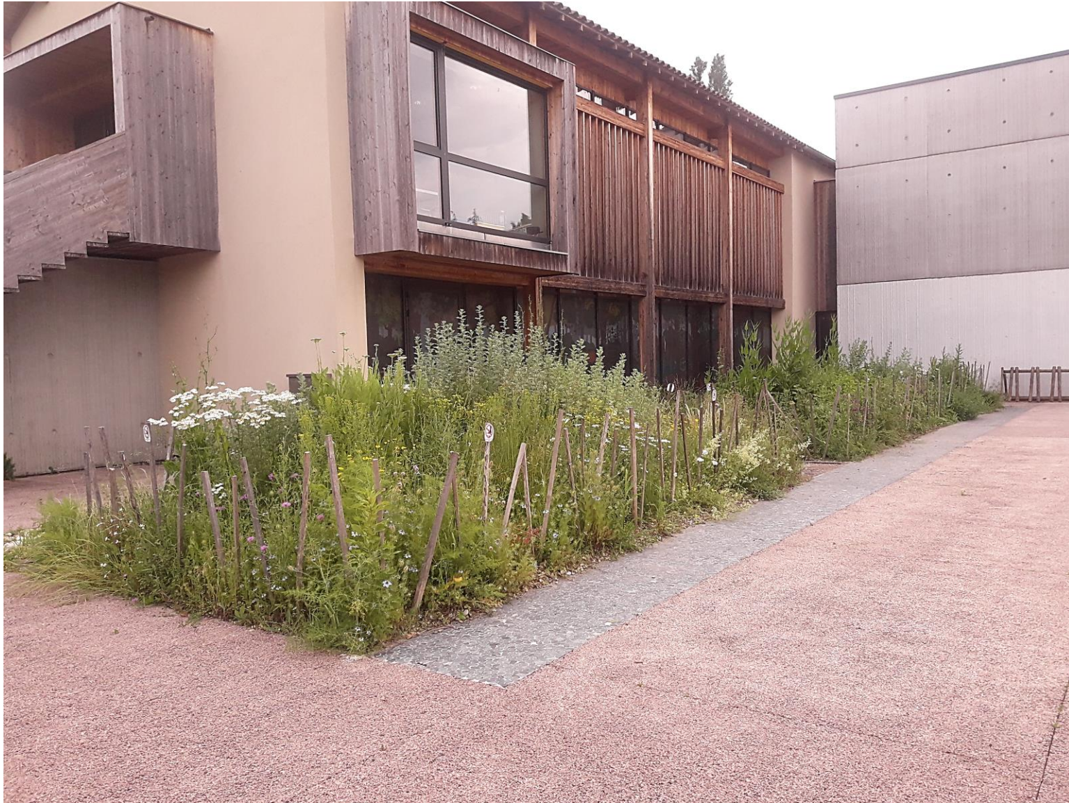
Grand Parc Miribel Jonage, Métropole de Lyon