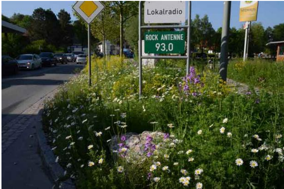
Commune d'Ebersberg, Allemagne