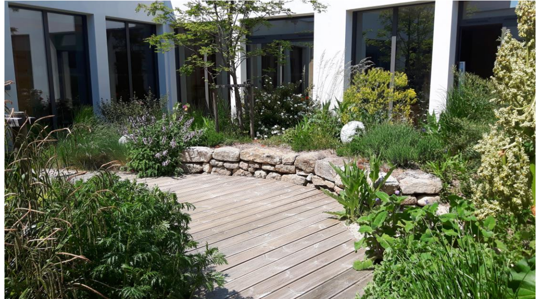
Maison de Santé rurale, Quintenas (07)