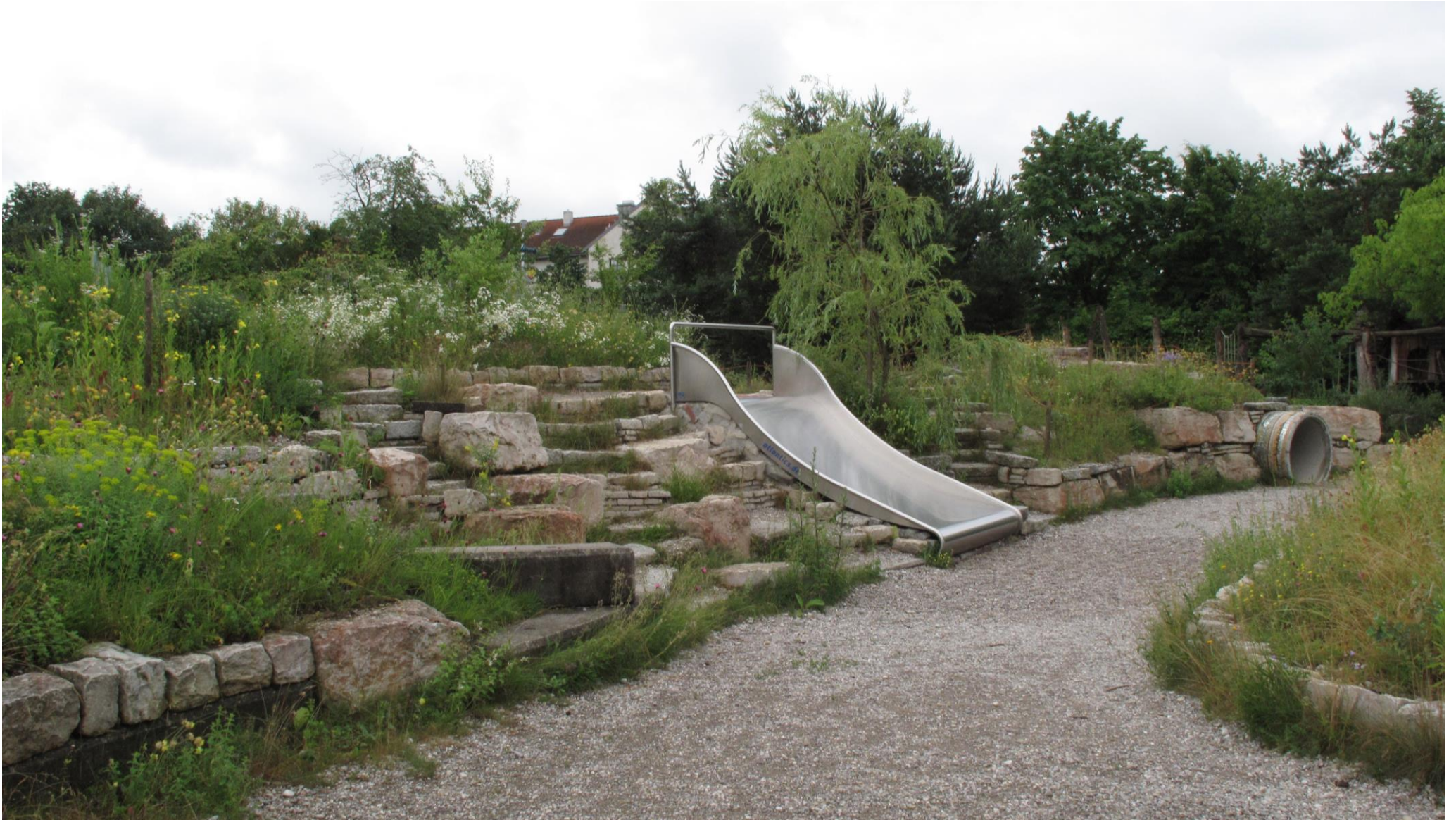
Ecole primaire public, Munich, Allemagne