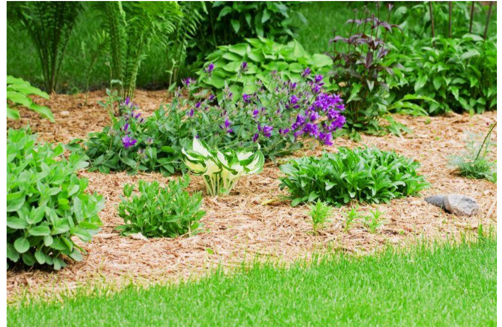
Paillage copeaux de bois