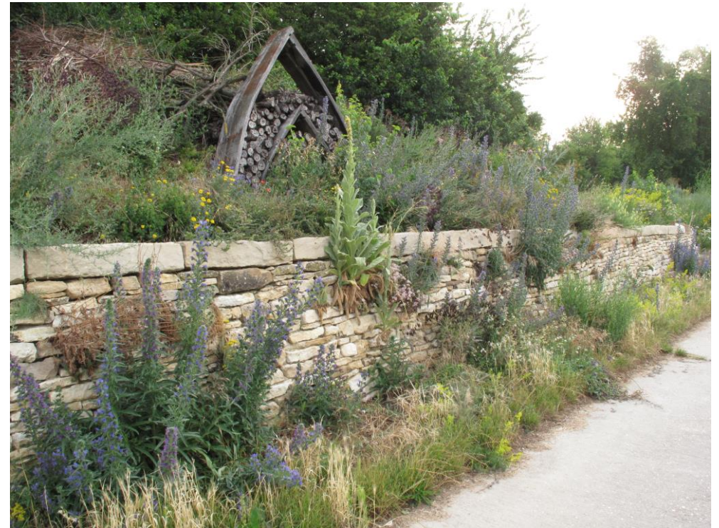
Chemin rural, Alzey, Allemagne