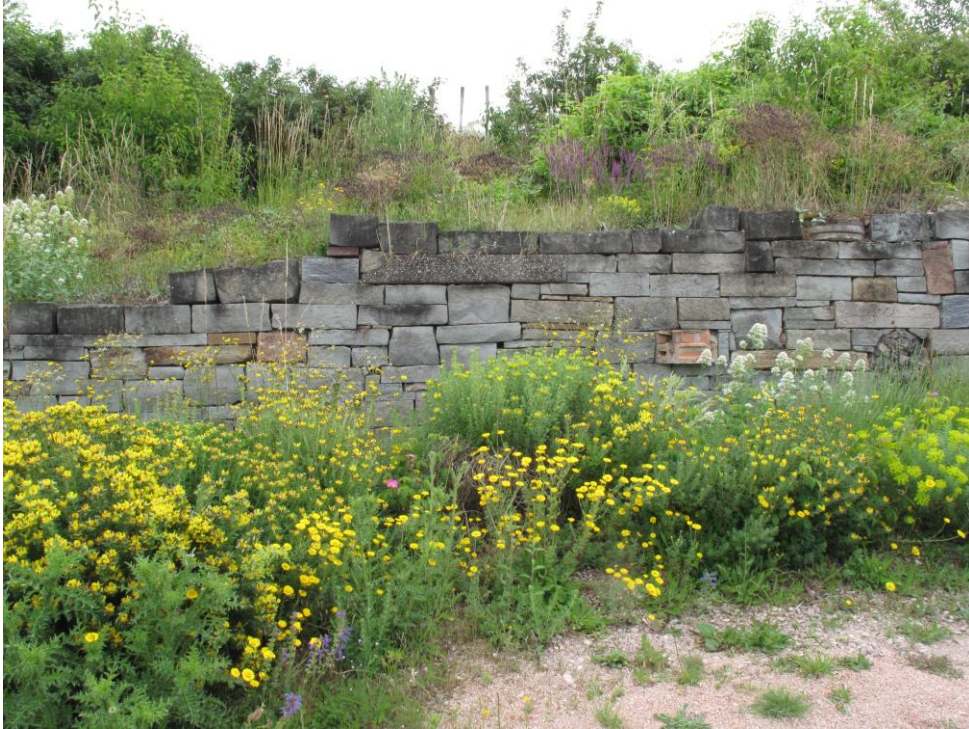
Entrée et parking d'entreprise, Allemagne