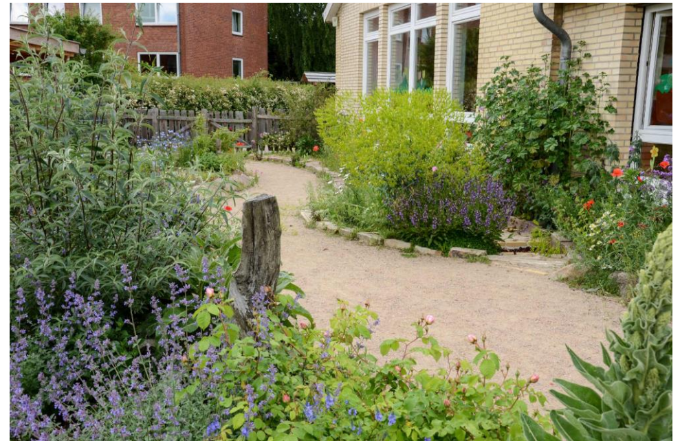
Entrée de crèche, Münster, Allemagne