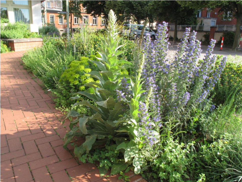
Préfecture Alzey, Allemagne